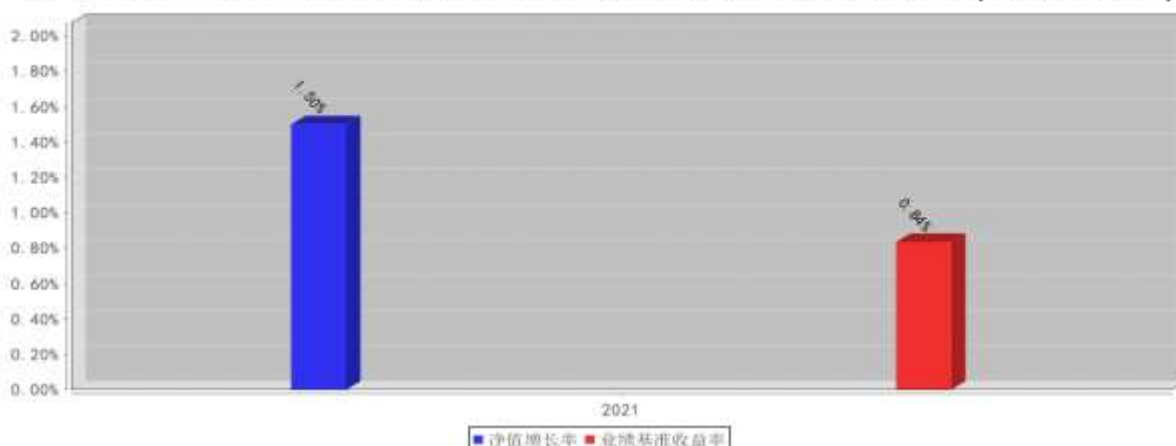
西部利得聚兴一年定开混合C基金每年净值增长率与同期业绩比较基准收益率的对比图(2021年12月31日)